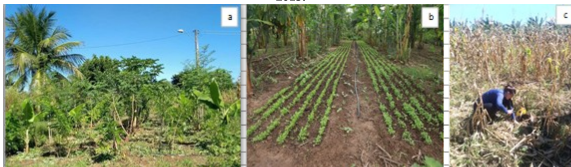
Figura 02. Áreas de coleta de solo: a - área 1, (SAF com 2 anos de implantação); b - área 2 (SAF com um ano de implantação); c - área 3 (Sistema de cultivo convencional: consórcio de milho e feijão). Juazeiro do Norte- CE, 2019.